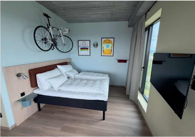
Fra Hushovd-suiten kan man sove under sykkelen Thor Hushovd vant sykkel-VM med i 2010.