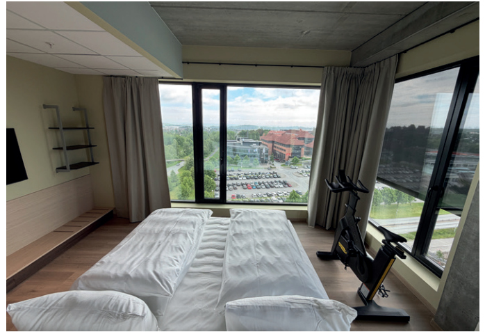
God utsikt fra Lauritzen-rommet – med treningssykkelen rett ved siden av senga.