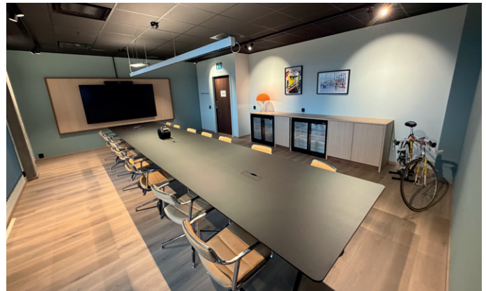
Møterommet «Lauritzen» er selvfølgelig oppkalt etter Dag Otto Lauritzen.