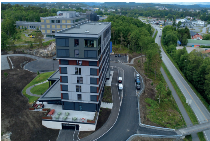
Nederst i billedkanten ser man innkjøringen til parkeringsanlegget.

første etasje samt limtegl ved inngangsparti. Taket er tekket med asfaltbelegg, sier Retterholt.