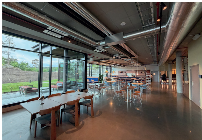
Arkitekt for utbyggingen er REN arkitektur mens HAEG Interiørarkitektur har vært interiørarkitekt.