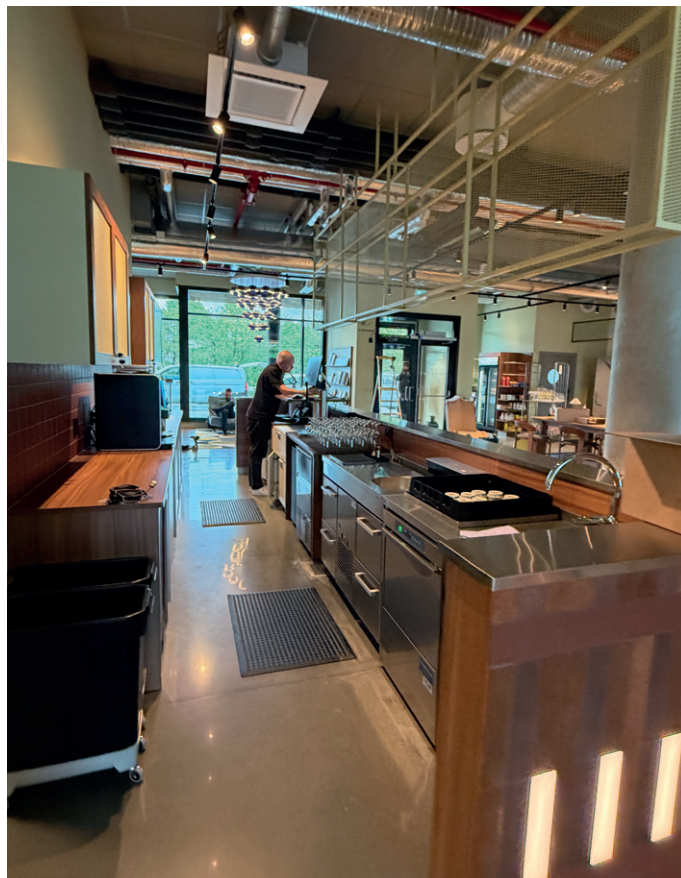
I første etasje er det en barception, som er en kombinert bar og resepsjon.

Med sine åtte etasjer er hotellet det høyeste bygget i Grimstad.