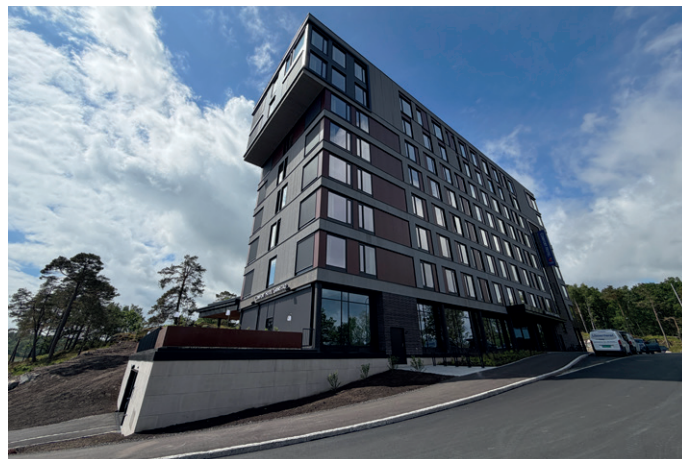
Byggherre for utbyggingen er Campus Hotel AS med Capitane Hotels som leietaker. Capitane Hotels har igjen inngått en franchiseavtale for merkevaren Comfort Hotel med Strawberry.

Hotellet har totalt 132 gjesterom, hvorav 14 handikaprom og fire suiter. I toppetasjens suiter har byens sykkelhelter Thor Hushovd