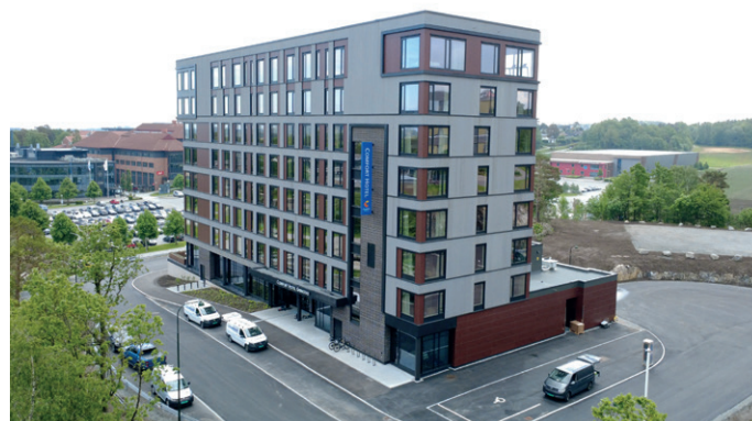
Bygget er på åtte etasjer pluss en kjelleretasje.