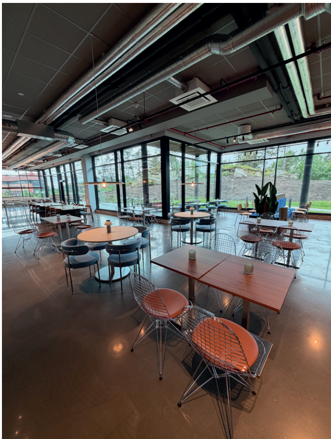
Fra restaurant/lounge i 1. etasje.